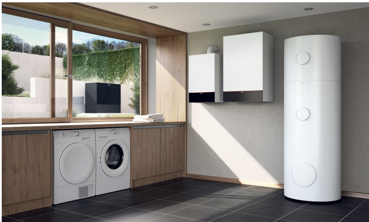
Hybrydowa pompa ciepła Vitocal 200-SH R32, współpracująca z kotłem Vitodens 200-W, z ustawionym obok zestawem Vitocell Modular - zasobnika c.w.u. (250 l.) i zasobnika buforowego wody grzewczej (75 l.)