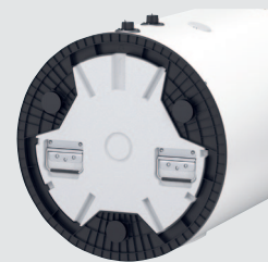
Zintegrowane uchwyty ułatwiają wstawianie pojemnościowego podgrzewacza c.w.u.