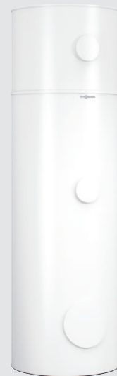
Vitocell 100-E 75 l + Vitocell 100-V 300 l