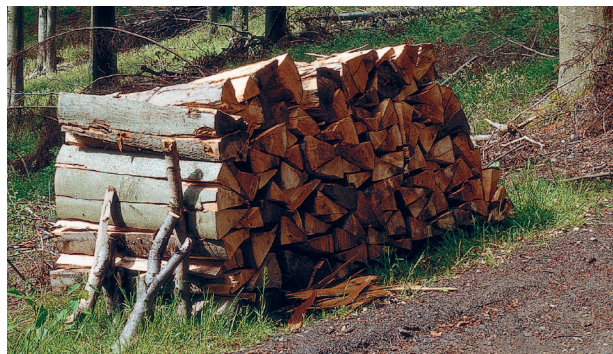
Ogrzewanie drewnem - najbardziej naturalnym paliwem na świecie

Kocioł Vitoligno 150-S pracuje z modulacją mocy i dopasowuje się bezstopniowo do aktualnego zapotrzebowania na ciepło. Układ regulacji spalania z sondą lambda i czujnikiem temperatury spalin rejestruje zawartość tlenu w spalinach i temperaturę spalin, dbając o niskie emisje substancji szkodliwych i wysoką sprawność kotła, do nawet 93,1%. W ten sposób Vitoligno 150-S oszczędnie pozyskuje z polan drewna użyteczne ciepło.