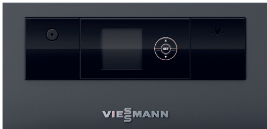
Regulator Ecotronic 100 z podświetlanym wyświetlaczem do prostej i intuicyjnej obsługi