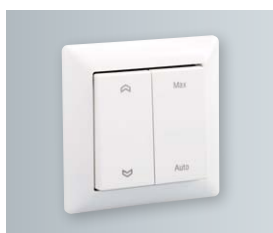
Estetyczny przełącznik bezprzewodowy (do współpracy z Vitovent 200-D, typ HRM lub HRV)