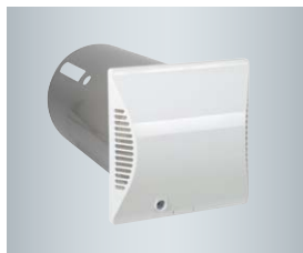
Okrągła tuleja ścienna z zewnętrzną osłoną ścienną