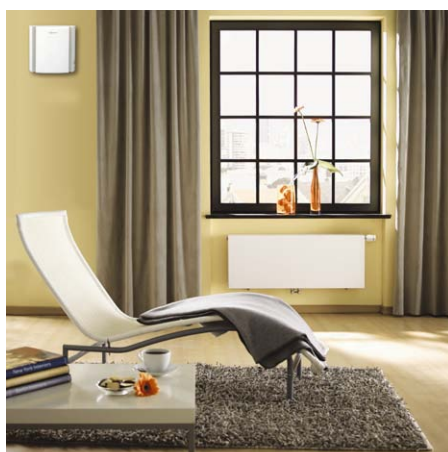
Instalacja urządzenia wentylacyjnego wymaga jedynie wykonania przepustu w ścianie zewnętrznej i przyłącza 230 V