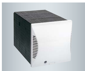
Kwadratowa tuleja ścienna z zewnętrzną osłoną ścienną